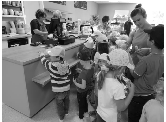
Lange Schlangen bildeten sich vor der Kasse, denn die Kinder hatten sich recht schnell für eine Süßigkeit entschieden.