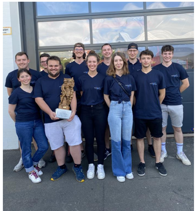
Freiwillige Feuerwehr Untereisenheim im Bild:

Am 06.06.22 hat eine Gruppe der Freiwilligen Feuerwehr Untereisenheim am Florianswettkampf auf dem Feuerwehrfest in Unterleinach mitgemacht. Die Gastgeber aus Unterleinach, die Feuerwehr Retzbach, die Freiwillige Feuerwehr Urspringen und die Untereisenheimer Wehr haben an dem Wettkampf im Rahmen der Feierlichkeiten zum 140-jährigen Jubiläum der Gastgeber teilgenommen. Mit einem minimalen Vorsprung von wenigen Sekunden konnte sich die Gruppe aus Untereisenheim gegen die drei anderen Wehren durchsetzen. Als Trophäe bringen die Untereisenheim den Wanderpokal „Flori“ mit nach Hause und obendrauf gab es für den ersten Platz ein Spanferkel, zu dem die Sieger die anderen Wehren selbstverständlich einladen werden.