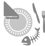
Essensreste, benutzte Pappeller, Einwegbesteck, Papierservietten