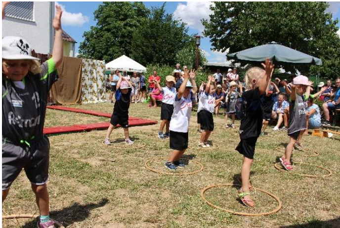
Sportlertanz der Kindergartenkinder

Zudem gab es großen Applaus für die einstudierten Tänze: