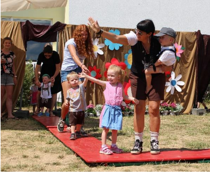
Trachtenmode aus dem Eulennest

Anschließend führten die Kinder in einer unterhaltsamen Modenschau die aktuelle „Trendmode“ vor: