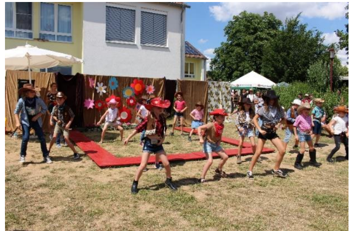
Westerntanz der Schulkinder