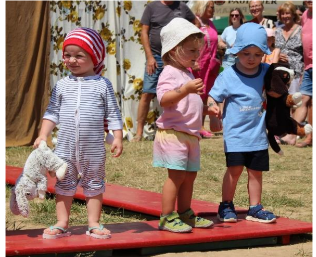
Nachtmode der Mäusenest-Kids

Für viel Begeisterung sorgten nicht nur die tollen Accessoires der Jungs, sondern auch die Braut, die den Bräutigam mit dem Cabriolet einfuhr.